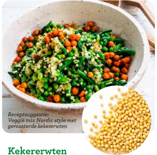
Receptsuggestie: Veggie mix Nordic style met geroosterde kekererwten