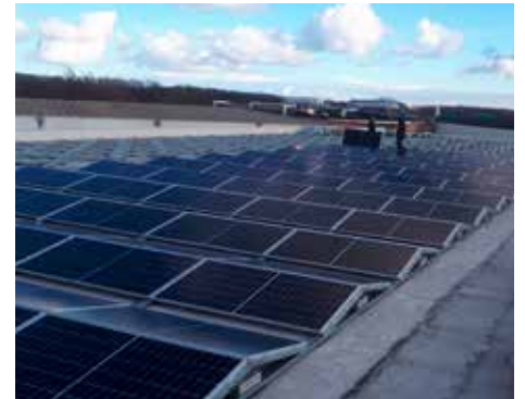
Verpakkingsmagazijn met zonnepanelen, Ardoorie