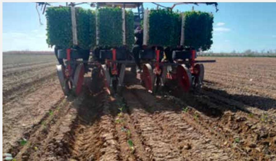
Broccoli zaaien in Spanje

Na een zeer lange winter in lockdown staan boeren en agronomen in de startblokken, klaar voor het nieuwe seizoen. De zaden worden stap voor stap geleverd aan de fabrieken, we controleren de kwaliteit van de kiemkracht en werken het plantschema voor seizoen 2021 af.