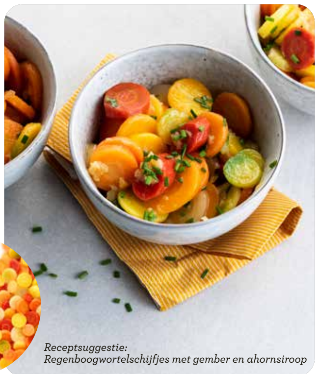
Receptsuggestie: Regenboogwortelschijfjes met gember en ahornsiroop

Dit voorjaar voegden we een nieuwe tint toe aan onze bestaande kleurrijke regenboog wortelschijfjes. Nu krijg je een hele regenboog, van wit tot rood, om een extra dimensie te geven aan je culinaire creaties , van BBQ side dishes tot wortelsalade bij de picknick. 100163510 – 4x2,5kg