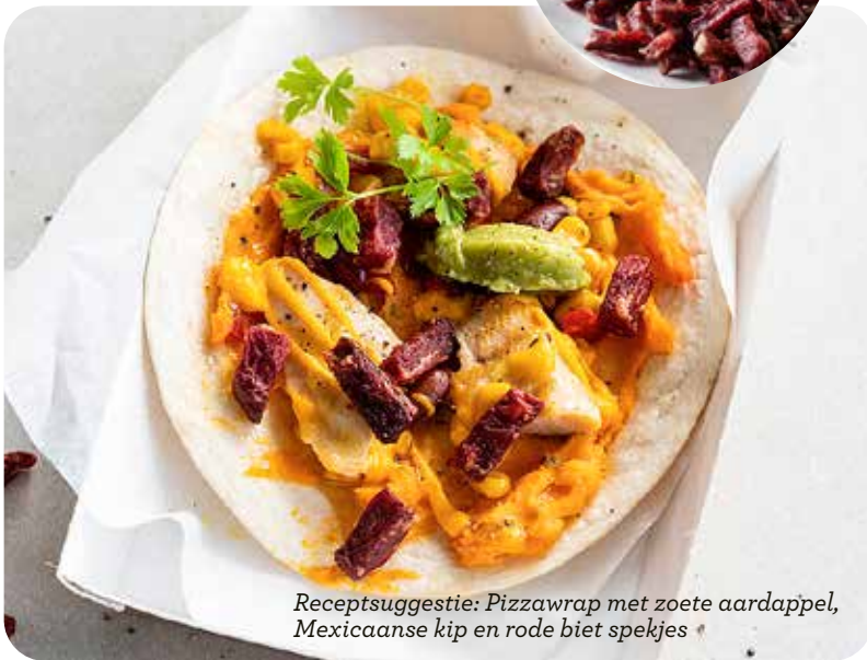
Receptsuggestie: Pizzawrap met zoete aardappel, Mexicaanse kip en rode biet spekjes