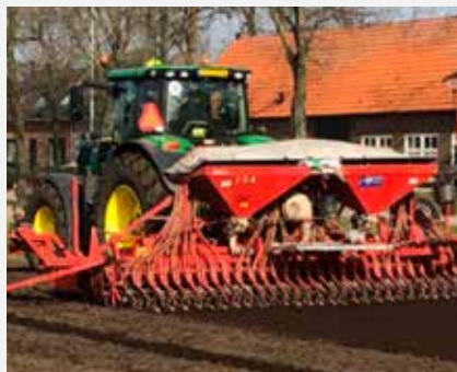
Erwten zaaien in Nederland