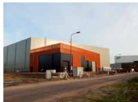
Vrieshuis Zundert, NL

In Zundert is een nieuwe bulkstockage gebouwd. De coldstore is duurzaam gebouwd met hoogwaardige materialen. Met een hoge isolatiewaarde en laag energieverbruik als positief resultaat. Daarnaast zijn er zonnepanelen op het dak geplaatst. In het moderne bedrijfspand is er ruimte voor 32.000 palletten. Er rijdt een reachtruck en er wordt gebruik gemaakt van Rangers die de pallets op hun plaats zetten.