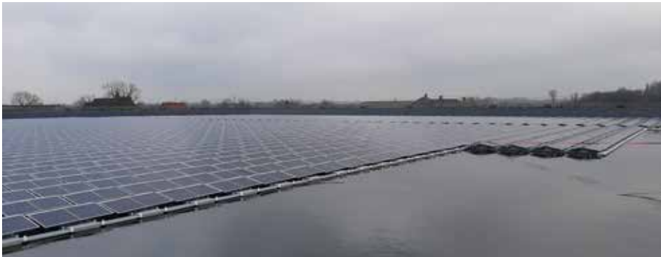
Irrigatiebekken met zonnepanelen, Ardoorie