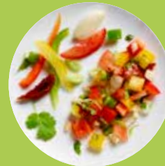
Mix Salsa Mexicana